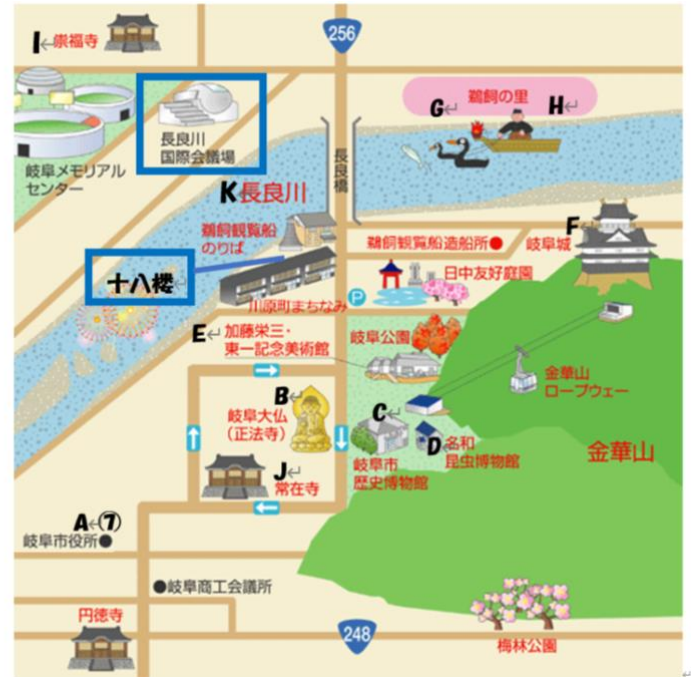
記念大会会場周辺図